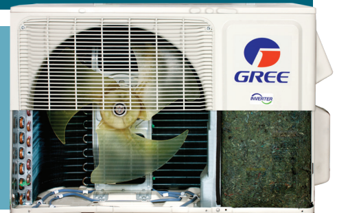
base avec élément chauffant

GREE équipe l'unité extérieure de l'Extreme d'une base avec élément chauffant qui empêche le gel de condensat et assure la pleine efficacité de l'appareil et une puissance de chauffage maximale.